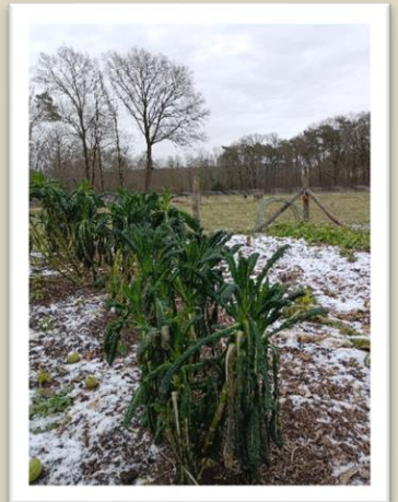
De tuin in winterslaap